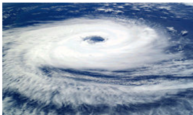
ảnh chụp của một mắt bão trên đại dương